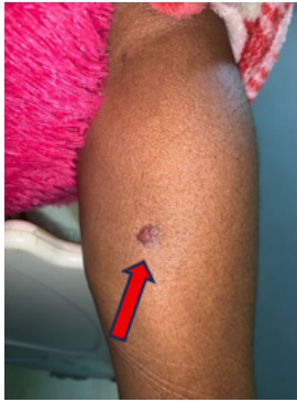
Gambar 1. Skar luka bekas gigitan anjing